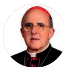
† Carlos Osoro Sierra Cardenal arzobispo de Madrid